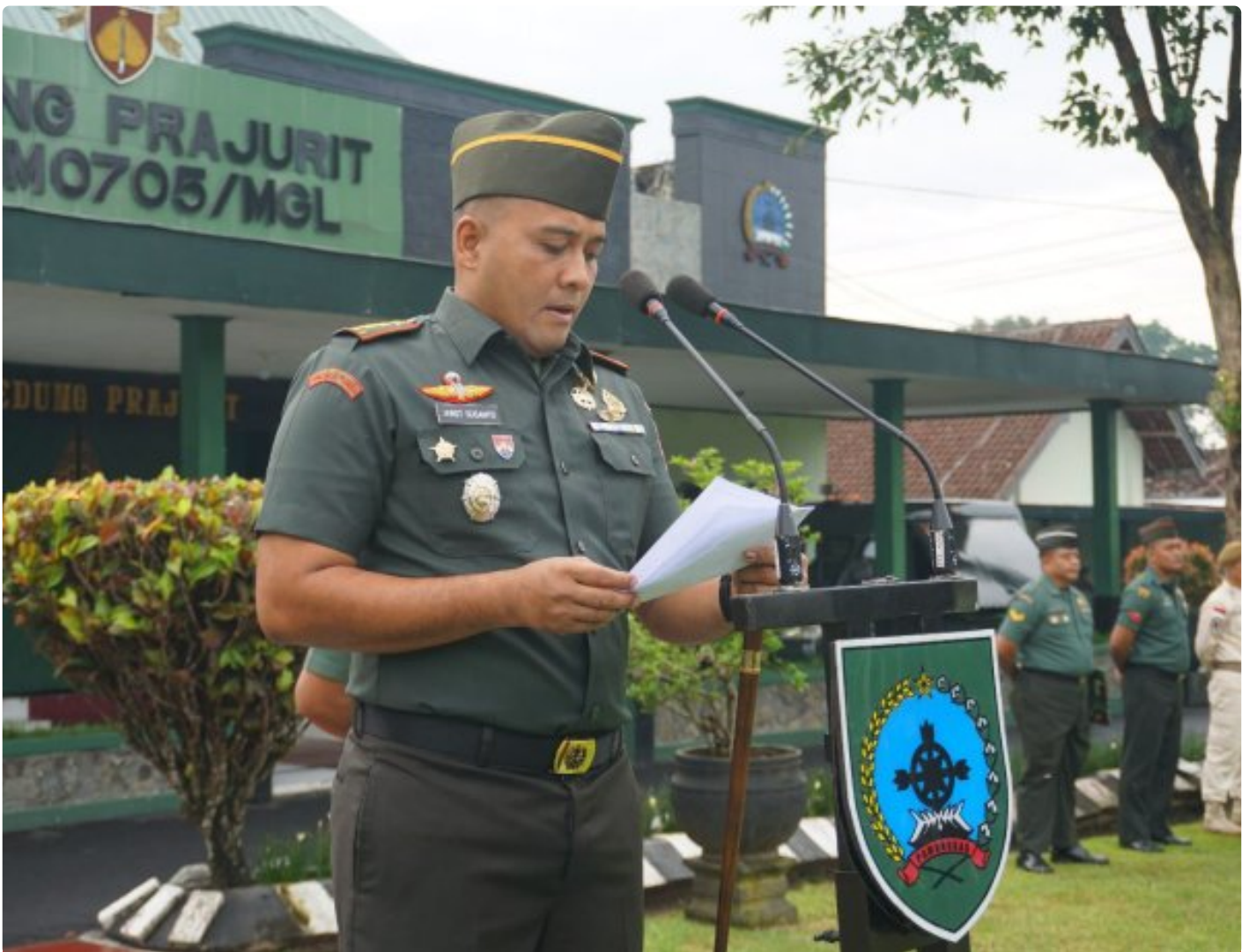
(Foto Dokumen) : Dandim Magelang saat membacakan amanat Pangdam IV/Diponegoro

MAGELANG - Kodim 0705/Magelang menggelar Upacara 17-an bertempat di